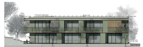
Haus 2 Ansicht Ost